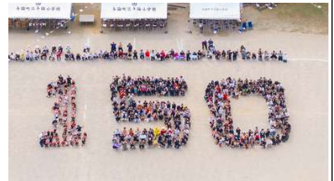
〔与論小150年の絆を深めた人文字〕

10月26日は創立150周年記念第129回運動会が開催されました。前日まで雨が降り続き、天候が心配されましたが、当日は快晴！天気までもが150周年を祝ってくれたかのようなでした。今年のスローガンは「150周年全力出し切るワラビンチャーと元ワラビンチャー」でした。児童は、かけっこにリレー、十五夜踊りにエイサーに全力を出し切るすばらしい姿を随所に見せていました。何より開会式の「運動会の歌」、元気な歌声が響いていました。児童の皆さん、感動をありがとう。そして、応援合戦、赤組も白組もみんなで力を合わせ、甲乙つけがたい最高の応援でした。運動会を大いに盛り上げました。応援団の皆さん、ありがとう。地域種目も大変盛り上がりしました。ワラビンチャーも元ワラビンチャーも一緒になり、創立150周年を盛大に祝う、心に残る運動会となりました。保護者の皆さん、地域の皆さん、ありがとうございました。