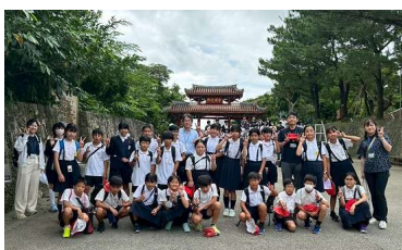
〔今年の修学旅行の様子〕

問題：次のできごとは、1960(昭和35)年～1975(昭和50年)のできごとです。一番古いできごとはどれでしょう？