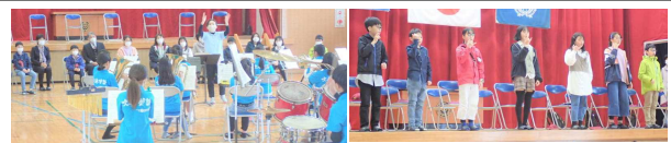
吹奏楽の演奏披露

これまで2年間程交流ができていなかった東十条小学校の子供たちが年末にやっと来島することができました。茶花小からエイサーや吹奏楽部の演奏を披露したり、東十条小の手話つきの与論の歌の発表を聞いたりできました。来年度は、延期された姉妹校盟約40周年記念事業を開催予定です。