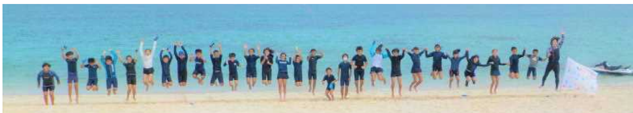
【6年生も最後の遠泳大会を参加者全員がAコースそして完泳とがんばりました！！】