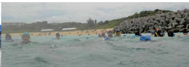
【向かい風にも、深い海にも負けじの心でがんばりました】