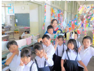
【「思イドウ運命」デンドオワラピンチャー】

1年生教室には、きれいな七夕飾りがあります。一人一人が短冊に願い事を書いて、笹の葉に気持ちを込めて飾ることができました。願い事がかなうといいですね。