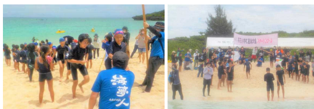
【ゴールでは校長先生が出迎え、グータッチ！】