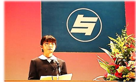
でっかい夢語り大会