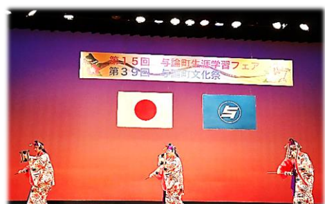
町琉舞教室（新人賞受賞者）