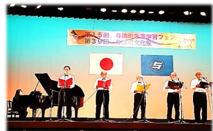
モーニングドアーズ