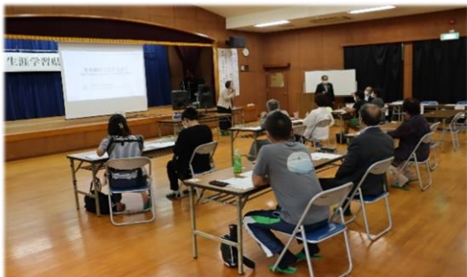
講座2（野元氏の講演の様子）