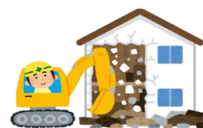
取り壊し（全部・一部）

家屋の全部または一部を取り壊したときは申請が必要です。必ず取り壊した年の年末までに手続きをしてください。取り壊した翌年度から固定資産税が課税されなくなりますが、手続きをしないと翌年度以降も課税が継続される恐れがありますのでご注意ください。