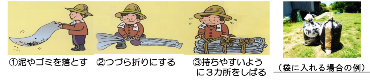
①泥やゴミを落とす ②つづら折りにする ③持ちやすいように3カ所をしばる (袋に入れる場合の例)