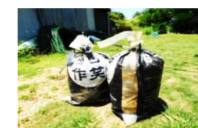
（袋に入れる場合の例）