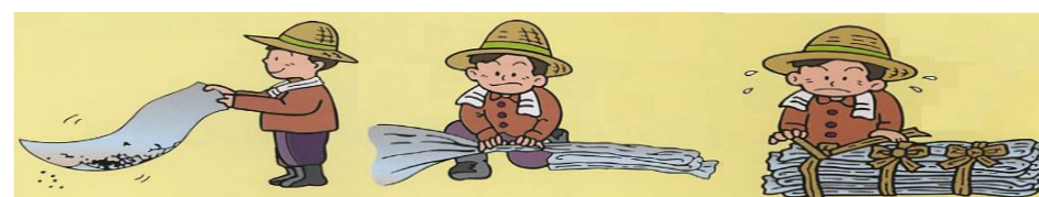
①泥やゴミを落とす ②つづら折りにする ③持ちやすいように3カ所をしばる