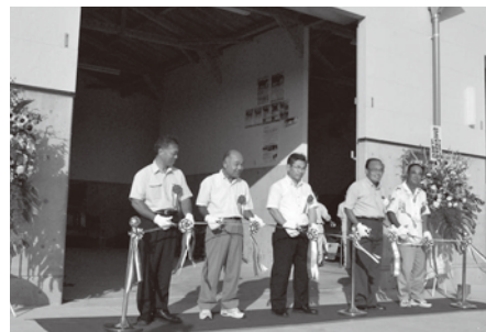
落成式・完成祝賀会が開催されました。

平成22年度地域ぐるみ防疫・衛生意識高揚対策事業(平成22年度資源循環化施設整備事業)により、堆肥セ