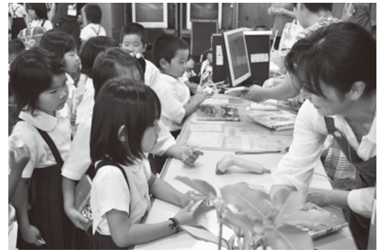
新しい貸出しカードで本を借りました。

今年、新一年生になった子どもたちが図書館へ招待されました。子どもたちは、職員から図書館の利用の仕方を丁寧に教えてもらったり、影絵シアターや読み聞かせを楽しみました。その後、館長さんに案内され、普段は目にするのではない書庫や本を運ぶエレベーターを見せてもらおうと、思わず驚きの声がありました。