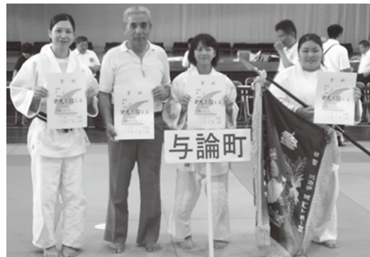
柔道(女子)では、団体・個人ともに素晴らしい成績を収めました。

第65回県民体育大会・第52回大島地区大会が、7月8日から10日まで、大島郡内12市町村において開催されました。本町からは18競技に選手が出場。健闘の結果、団体競技2種目で優勝、また個人競技9種目で優勝という、素晴らしい成績を収めました。選手の皆さん、応援していた町民の皆さん、お疲れさまでした。