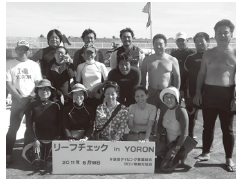
島のサンゴ礁の調査が行われました。

サンゴ礁再生の取り組みとして毎年2回実施されている、リーフチェック。今回は、島内外から16名のダイバーが参加しました。サンゴの状態は劇的に良くなっているわけではありませんが、このような活動がサンゴ再生への第一歩につながることを願います。併せて、有志によるビーチクリーンナップも行われました。