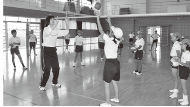
パスの練習。初めてでも、上手にできました。

今回講師を務めるのは、1976年に開催されたモントリオールオリンピック、バレーボール金メダリストの中村きよみ氏（旧姓加藤）。