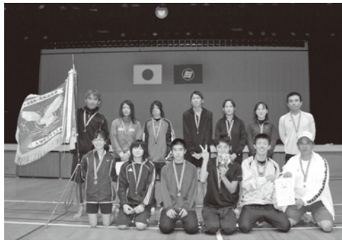
優勝した、アガサチームのメンバー