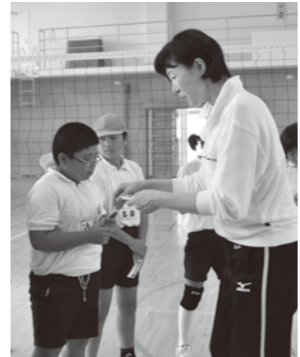
記念に金メダルのパストカードを頂きました。