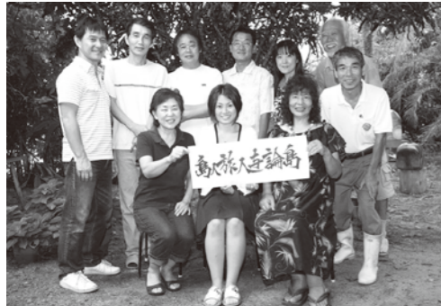
新しい目線で情報発信を目指すメンバー

与論島から新しい島の文化を広く伝えたいという思いから、与論島に移住してきた作家や島民ら12名が集まり、「島人旅人・与論島」が結成されました。メンバーはこのたび、ポストカード「Art message in Yoron」を作成。島に縁のある作家の作品を与論島の風景の中に置くことで、アートと島の自然の融合を表しました。今後、それぞれの得意分野を生かして、与論島の情報発信を行っていくとのこと。