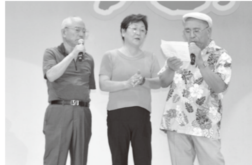
去年以上の盛り上がりを見せました。

十九の春発祥の地といわれる、この与論島で「十九の春」世界大会 in ヨロシマ 2010大会が開催されました。大会には沢山の観客が集まり出場者は「カラオケの部」「三味線・太鼓の部」「男女ペアの部」「団体の部」に分かれ、自