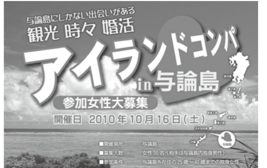
初めての試みでしたが、大盛況でした。

初めての試みである「観光時々婚活アイランドコンパ in 与論島」が与論町商工会青年部主催により行われました。北は北海道、南は沖縄まで9名の女性が参加し、午前中には女性陣のみで島内観光を楽しみ、昼食