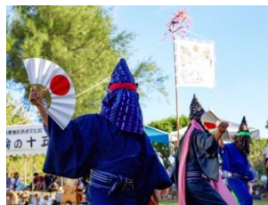
十五夜踊り保存事業