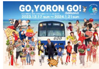
地域包括的PR特別対策事業