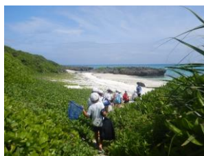
海の環境保全活動の推進