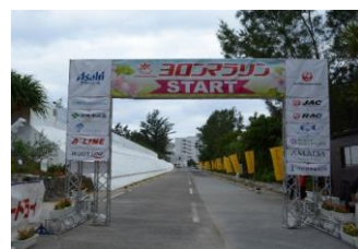
ヨロンマラソン開催事業