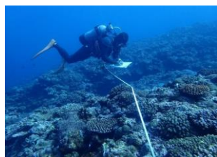
サンゴ礁保全事業