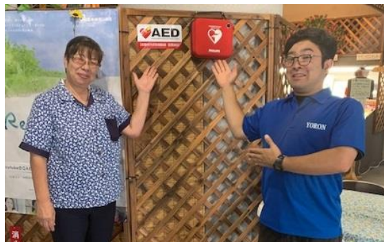
▲写真2 観光施設にAEDを設置しました