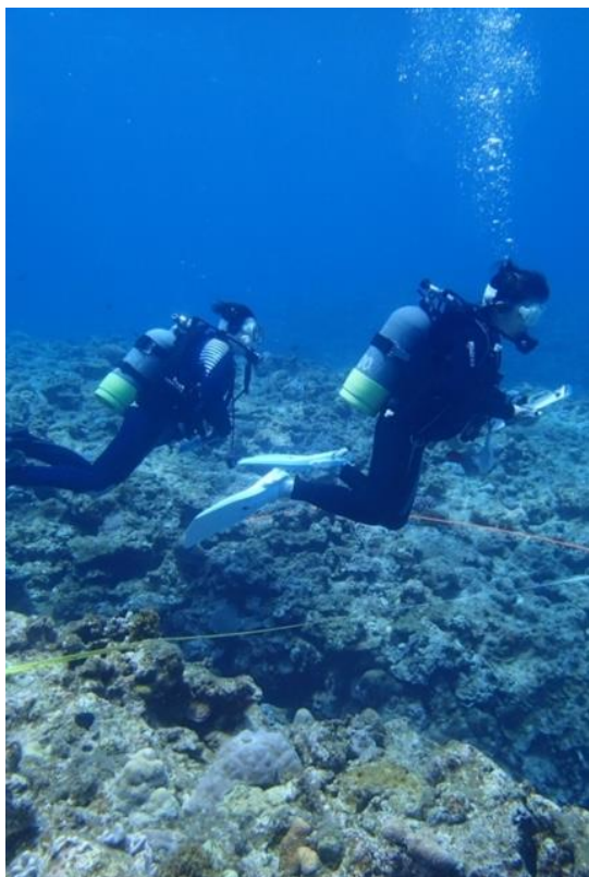
▲写真1 リーフチェックを行いました