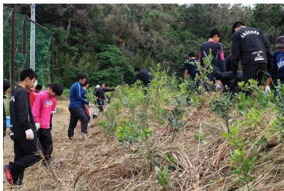
▲写真3 植樹祭を開催しました