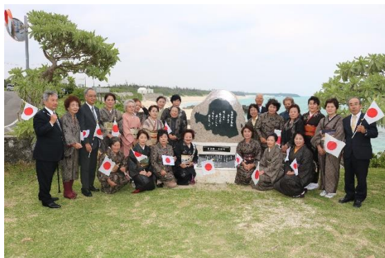
▲写真4 皇后陛下御歌碑と共に記念撮影