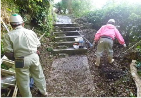
◆寄附者のお声から、地主神社周辺の歩道の補修作業を行いました