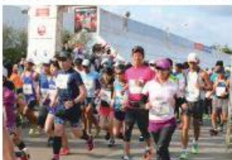
ヨロンマラソンの風景

寄附者に対しては、お礼状を送付する際に与論町のガイドブックや町広報誌等を同封することで、与論町の現状を報告すると共に町の魅力を伝えており、ふるさと納税で生まれた縁を大切にしています。