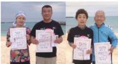
遠来賞(左)、最高齢賞(右)の受賞者