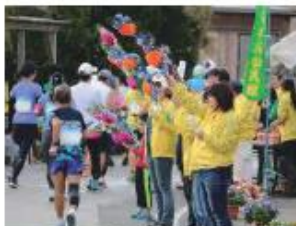
ヨロンマラソンのボランティア

海岸清掃は、島外からの参加者を巻き込む活動に発展しており、これらの活動により、住民や町を訪れた観光客の環境美化意識が高まり、年々海岸が美しくなっています。