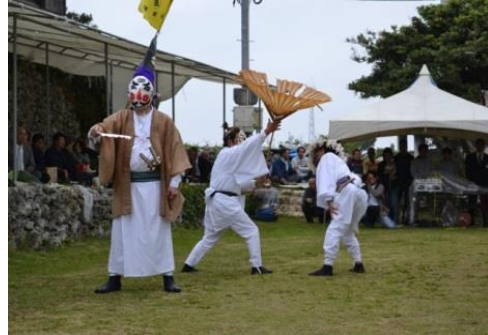
◆十五夜踊りで使用する古くなった衣装を新調しました