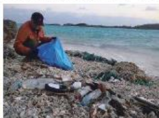
海岸清掃の様子 海から流れてきたゴミを拾うボランティア