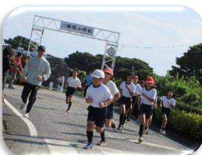
〈力強い走りで見守る児童を引っ張る伴走者〉