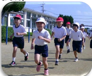
〈たくさんの声援に背中を押され頑張る児童〉

子供たちは心強い伴走とたくさんの応援のおかげで、練習の成果を発揮し、完走することができました。また、たくさんの児童が自己新記録を更新しました。保護者、地域のみなさん多くのご声援ありがとうございました。