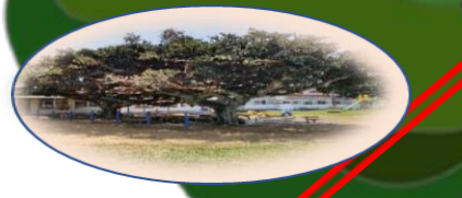
シンボルツリー「すくすく」「のびのび」 ガジュマルの木