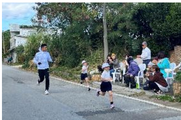
【 力強い走りで児童を引っ張る伴走者 】