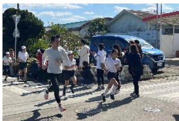
【 沿道での応援により頑張る児童たち 】