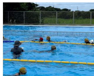
【 練習の様子 】

6 月 20 日 (木) に実施される遠泳大会に向けて、4 ~ 6 年の児童が練習を重ねてきています。A・B・C、3 つのコースに分かれ泳ぎます。検定結果からコースが決定します。どお児童も真剣に練習しています。