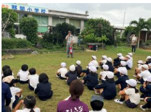
【火災に関する講話】

火災の避難訓練を実施しました。子供たちは教室から放送や「火事だ～」のかけ声を聞き、校庭に避難しましたが、真剣さに差が見られ、消防署の方から指導を受けました。今後の教育活動を通し、再度、命を守る行動をどうするか、『もしもに備える重要性』を指導していきたいと感じました。また、消火器の使い方だけでなく、その重さなど、実際にイメージして今後活かさせたいです。