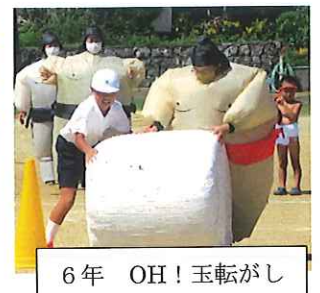
6年 OH! 玉転がし