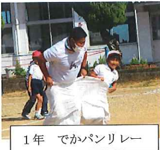
1年 でかパンリレー