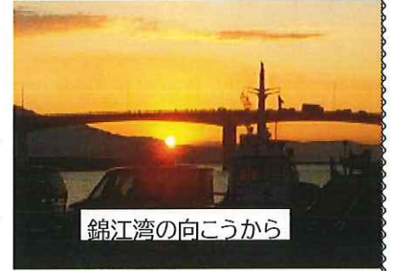
錦江湾の向こうから

さて、今年の干支は「壬寅（みずのえとら）」。この干支についてちょっと調べてみた。「壬」は「妊に通じ、陽気を下に妊（はら）む」、「寅」の字には「蟻（ミミズ）に通じ、春の草木が生ずる」という意味があるとあった。そのため「壬寅」は厳しい冬を越えて、芽吹き始め、新しい成長の礎となるイメージということ。「厳しい冬」はまさしく「コロナ禍で大変な時期のこと」にあたり、みんなで協力し合い、乗り越え、伸びようとしている私たちではないだろうか。今年こそはコロナを脱却したい。そんな願いを皆強く感じていることと思う。