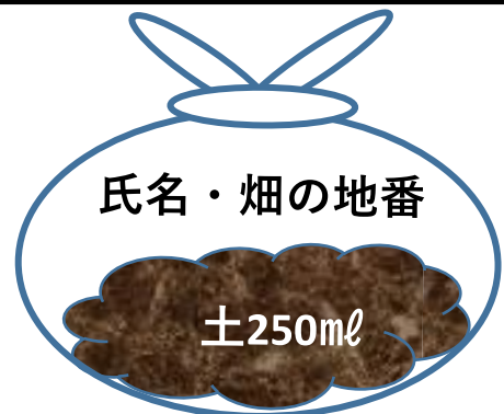
ビニール袋に入った提出時の土

その中から250ml (500ml ペットボトルの半分ほど) の土をビニール袋に入れて、 名前と畑の地番 をビニール袋に記入のうえ土壌診断センターに提出してください。通常2～4週間で診断結果が出ます。